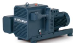
C-VLR ZEPHYR vacuum only · aplicación de vacío