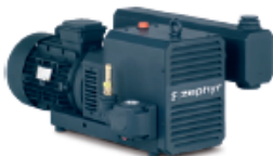
C-DLR ZEPHYR compressor · compresor