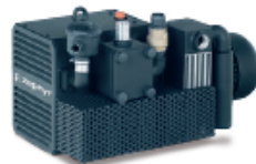
C-KLR ZEPHYR combination · combinación